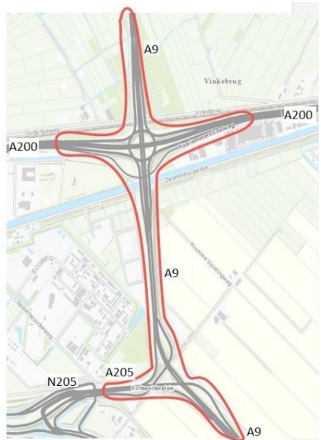
Figuur 1: Projectgebied

Het studiegebied reikt verder dan het projectgebied; dit is het gebied waarvoor de effecten van de onderzochte maatregelen in beeld worden gebracht. De omvang van het studiegebied kent geen harde grenzen. Het studiegebied wordt bepaald door te verwachten effecten van de maatregelen en verschilt daarmee per te onderzoeken aspect. In het BO-MIRT is afgesproken om met het oog op een eventuele studie naar een verbreding van de A9 tussen Rottepolderplein en de Wijkertunnel de effecten van de ontvlechting voor in elk geval dit traject in beeld te brengen. Daarnaast wordt ook de impact op het functioneren van de draaischijf rond Amsterdam ook bestudeerd in deze Verkenning.