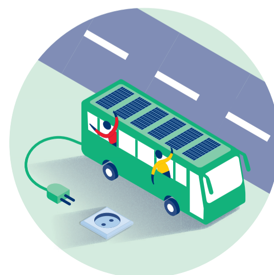
Duurzaam openbaar vervoer