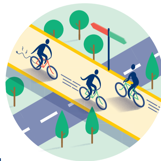
Fietsroutes en -netwerk