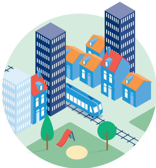
Verdichten steden en dorpen / autoluw