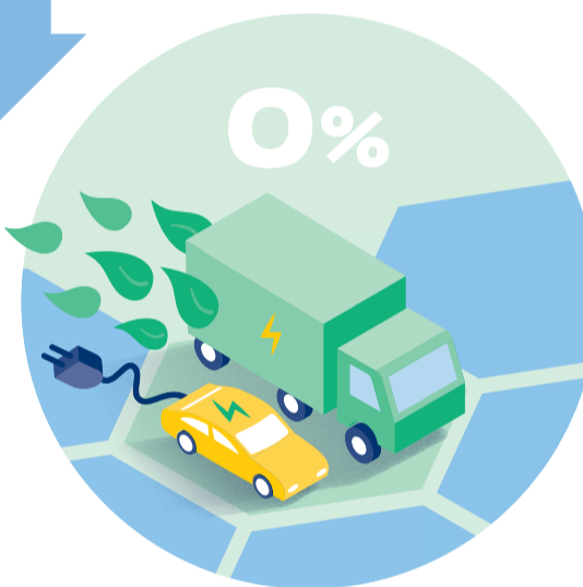
ZERO Emissie Zones